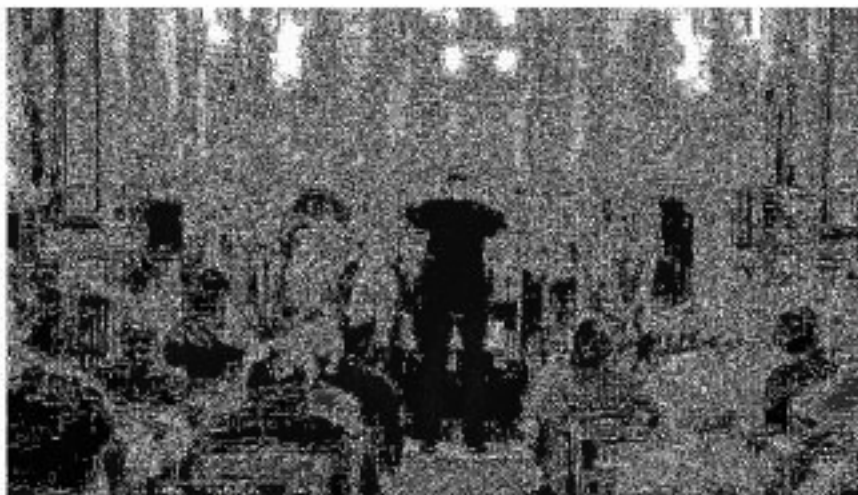
Le groupe Freedom captive l'assistance.

C'est un magnifique concert de gospel que propose le Club des Sans-soucis et la chorale ébroïcienne Freedom, ce vendredi 27 mai, à Saint-Eloi-de-Fourques. Ils ne sont pas loin de 40 chanteurs à ravir les oreilles du public. Ce premier concert est un réel succès : l'église est