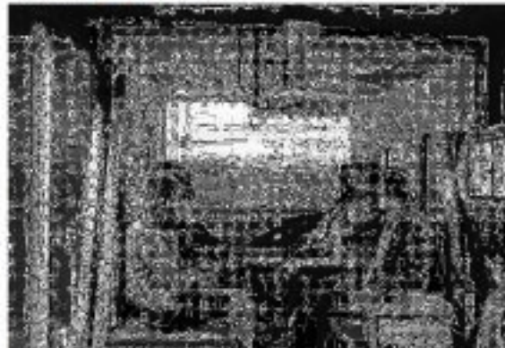
A l'intérieur du camion-cinéma.

Il sera à la fois un lieu de rencontre, d'accueil, mais aussi un espace de création, d'enregistrement, un cyber-café avec connexion Internet, un « cinéma forain », où règne l'envie de créer des films avec les gens, ceux qui vivent en habitats légers ou mobiles, puis de les projeter et les regarder tous ensemble.